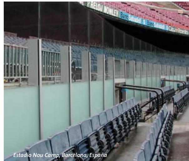
Estadio Nou Camp, Barcelona, España