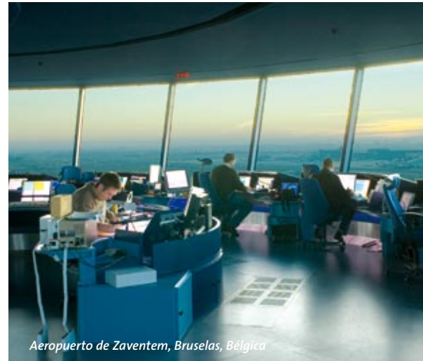
Aeropuerto de Zaventem, Bruselas, Bélgica

Consulte los siguientes documentos: "SGG VISION-LITE: Instrucciones de uso" y "SGG VISION-LITE: Ensamblado, instalación y mantenimiento".