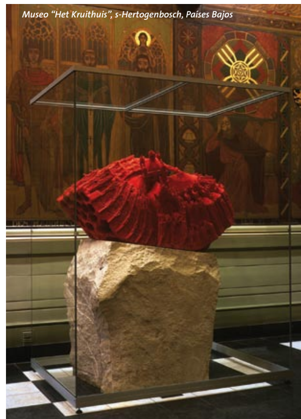
Museo "Het Kruihuis", s-Hertogenbosch, Países Bajos