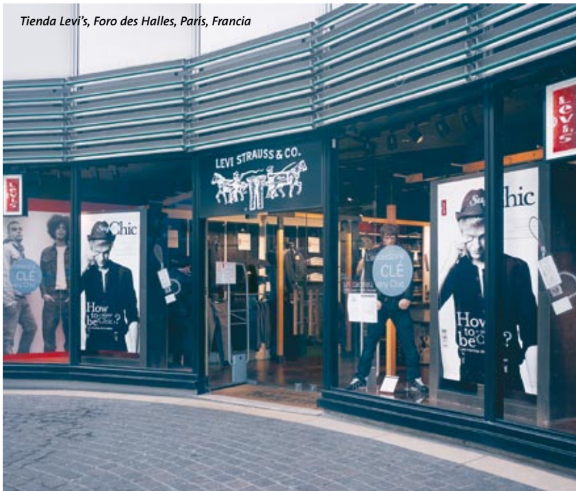
Tienda Levi's, Foro des Halles, París, Francia