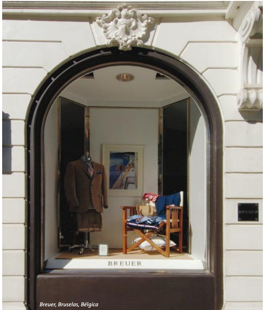
Breuer, Bruselas, Bélgica

dimensiones para escaparates o grandes vitrinas.